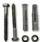
Montageset 1 (wird 2x benötigt)