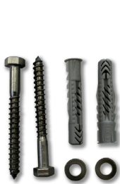
Montageset 1 (wird 2x benötigt)