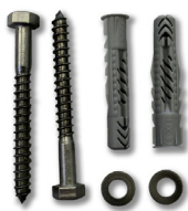
Montageset 1 (wird 2x benötigt)