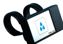
Funkfernauslöser FMI / E