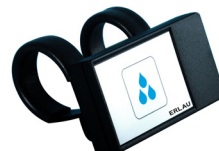
Funkfernauslöser FMI / E